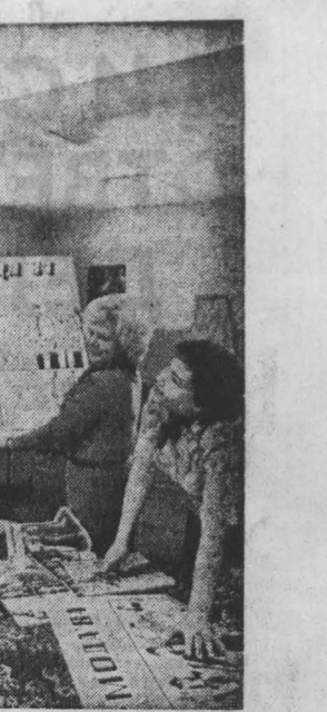
Конструкторы экспериментальной лаборатории объединения «Кузбассвентб» первыми в нашей области встречают новую моду. А чтобы достойно ее принять, они детально изучают всегда новый ее характер. Словом, инженерно они разрабатывают конструкции новых модных моделей одежды, чтобы затем расстать уже готовые изделия по всем ателье. По ним и учатся закройщики кроить новомодные изделия — блузы, платья, костюмы и другое.

Человек и его дело. Спорт. Информация. Спрашивай-отвечаем.