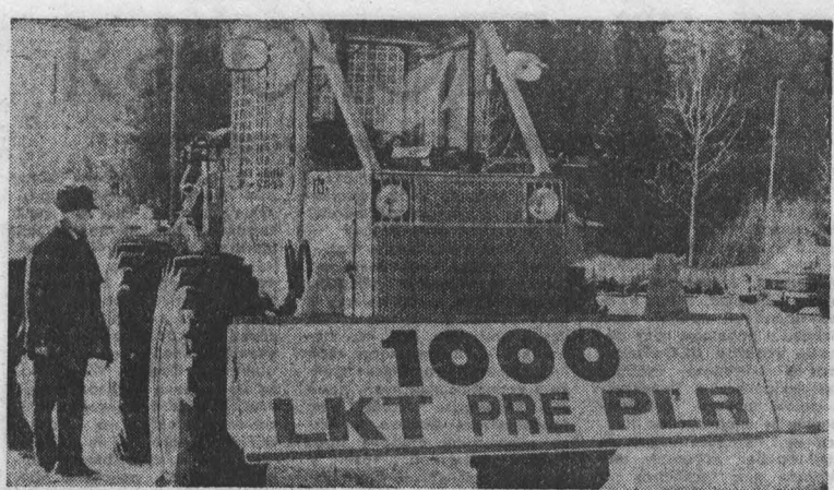
ПНР. Расширится экономическое сотрудничество Польской Народной Республики с Советским Союзом и другими социалистическими странами...