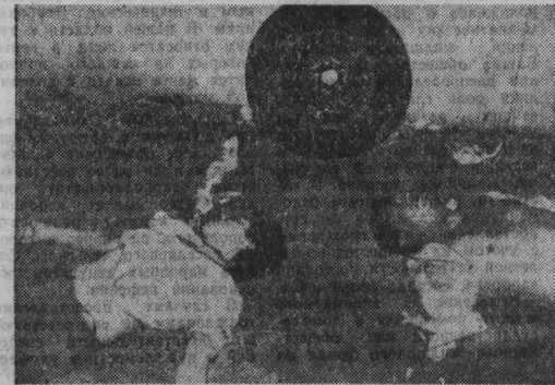
ОРУДУЮЩИЕ в Сальвадоре ультраправые «эскадроны смерти» уместочат в стране кампанию террора.

А БУДАПЕШТ. Глубокие бурения применены в Венгрии сравнительно недавно. Но уже сейчас не в далеких странах, а в местных и газовых скважинах на глубину 4000-5000 метров.