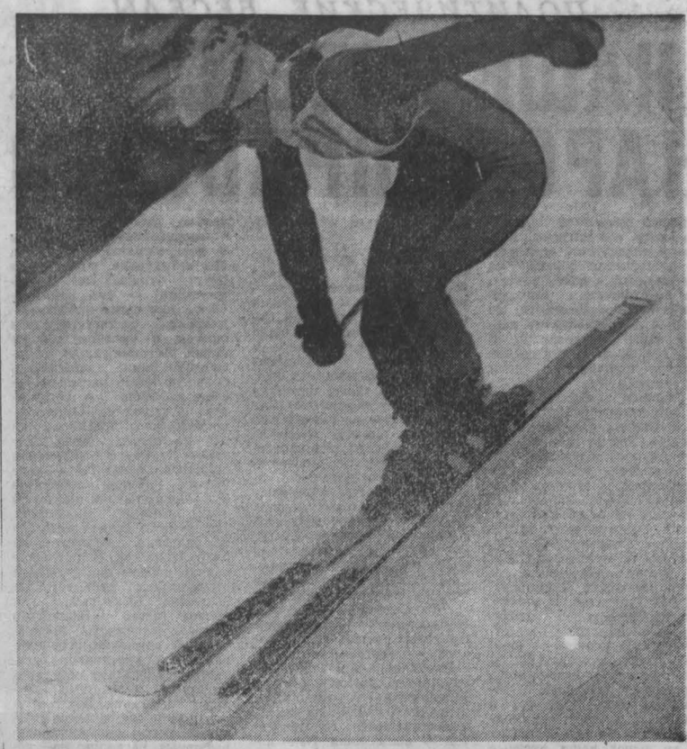
Гора Буланне — излюбленное место тренировок и соревнований горнолыжников. НА СНИМКЕ: на трассе слалом-гиганта.