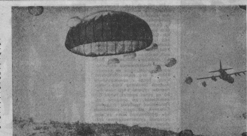
Соединенные Штаты превращают Гондурас в опорный пункт Пентагона в Центральной Америке.