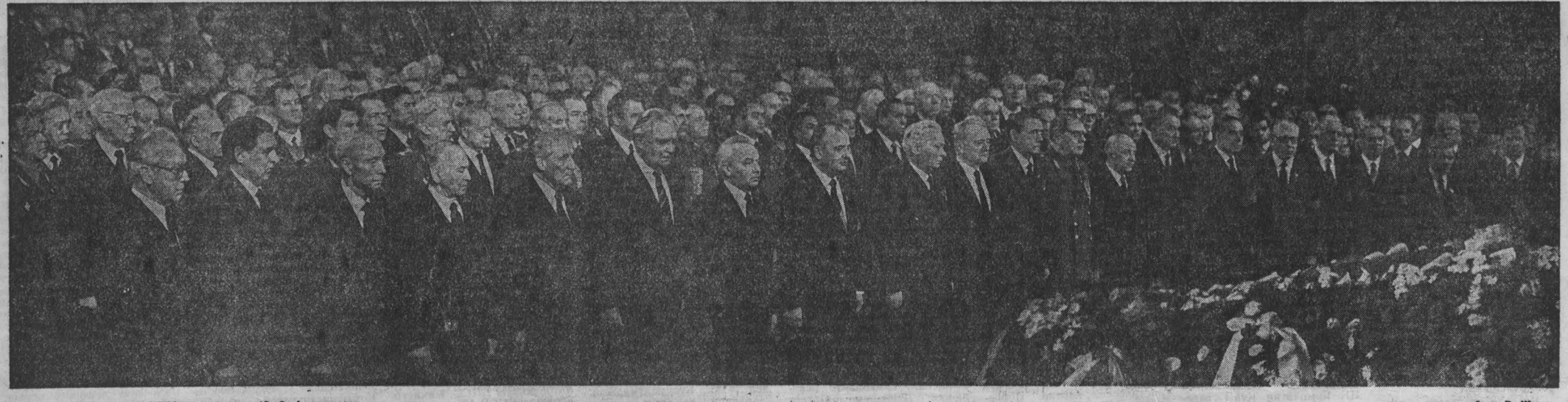
Участники Пленума ЦК КПСС прощаются с Ю. В. Андроповым.

Сердцем и умом коммунисты, трудящиеся республики, как и все советские люди, восприимчиво и единомысленно поддерживают современную стратегию нашей партии — стратегию совершенствования зрелого социализма, в формировании которой столь велика роль Юрия Владимировича Андропова. Прошедший вчера Пленум Центрального Комитета вновь со всей силой подтвердил верность нашей партии этой стратегии, ее непреклонную решимость твердо следовать ленинским генеральным курсом, курсом XXVI съезда. Цели, за которые так самоотверженно боролся Юрий Владимирович Андропов, будут воплощены в жизнь. Прощай, наш дорогой Юрий Владимирович!