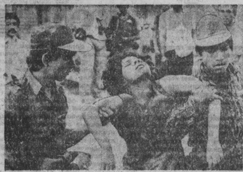
Досье преступлений фашизма

И А СНИМКИ из «Намера пресс»: карты ведут на допрос девушки, арестованную в пригороде Сан-Сальвадора. Фотохроника ТАСС.