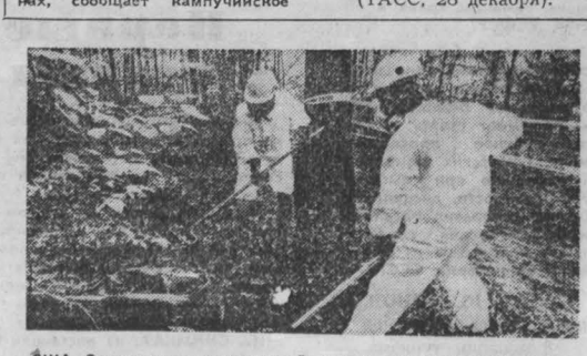
США. Загрязнение окружающей среды американскими корпорациями в настоящее время приобрело огромные масштабы. Пользуясь попустительством властей, предприниматели «экономит» на обезвреживании и безопасном хранении...