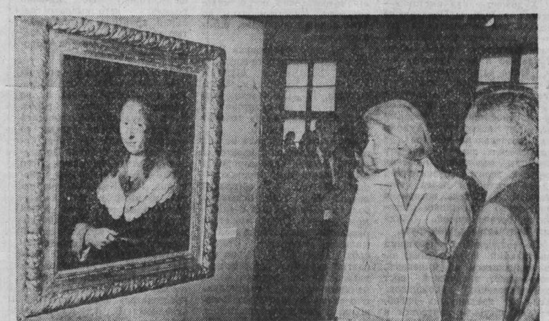
ПНР. Ярким примером плодотворного сотрудничества культурного сотрудничества и тесных связей, поддержки взаимных интересов...

КАБУЛ, 28. (ТАСС). МИД ДРА выступил с заявлением по поводу непрекращающихся актов вооруженной агрессии против ДРА со стороны Пакистана. В нем отмечается, что только за последние два месяца вооруженные силы Пакистана 19 раз обстреливали территорию ДРА из дальнобойных орудий.