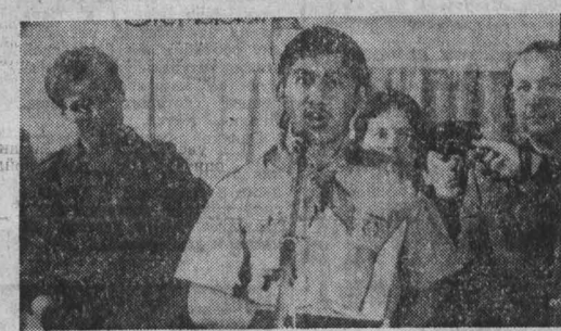
Трудящиеся ГДР возмущены новыми агрессивными действиями США против Никарагуа, которые являются открытым нарушением элементарных норм международного права.

— Девятимесячная забастовка английских шахтеров — самый длительный, сложный и ожесточенный трудовой конфликт в послевоенной истории Великобритании, — говорит Малкольм Питт, президент кентского отделения британского профсоюза горняков. Официальная пропаганда ежедневно убеждает англичан в том, что причина конфликта лежит якобы в разумном решении правительства закрыть «неэкономичные» шахты, тем самым удешевив стоимость каждой тонны угля. А шахтеры, дескать, упрямо отказываются принести жертву в национальных интересах: смирились с закрытием 20 шахт и потеря 20 тысяч рабочих мест.