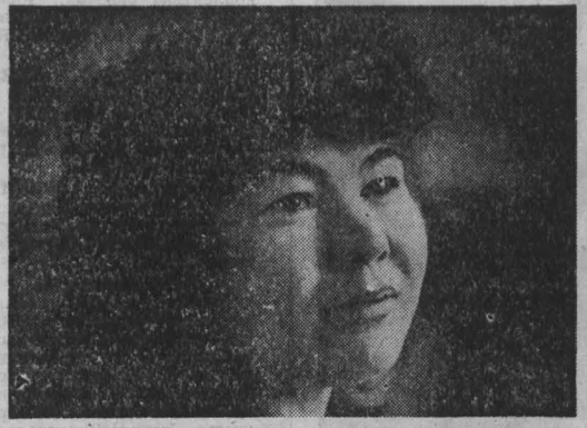
НА ШВЕЙНОЙ фабрике «Искра» хорошо знают передовых работников...