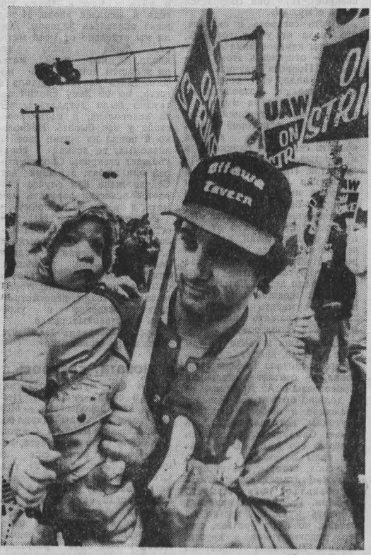
Победа закончилась продолжалась почти две недели забастовка 36 тысяч канадских автомобилестроителей, занятых на предприятии концерна «Дженерал моторс оф Канада лимитед». Профсоюз, представляющий интересы канадских автомобилестроителей, добился от «Дженерал моторс» удовлетворения своих требований о повышении заработной платы, улучшения пенсионного обеспечения. НА СНИМКЕ: участники пикетов рабочих и членов их семей в городе Виндзор (провинция Онтарио).

А ДЕЛИ. Индийские пограничники задержали пачку табачных сигарет при попытке пересечь государственную границу из провинции Уттаракханд. Сообщает агентство ПТИ. Арестованные принадлежат к крайне экстремистским синхским организациям и ранее записывались в ряды безопасности страны в связи с многочисленными преступлениями, совершенными ими в Пенджабе. У бандитов обнаружили карты «Халифата» существующего государства, создание которого экстремисты продолжают добиваться на территории этого штата. В ходе начавшегося расследования установлено, что раскольники подерживали тесные связи со спецслужбами Пакистана, от которых они получали оружие, боеприпасы и финансовые средства для ведения подрывных операций и вооруженных вылазок в Индии.