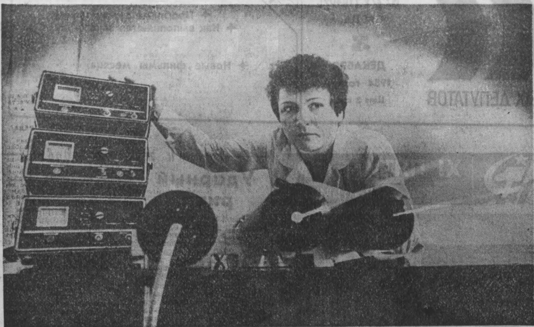
ЛАБОРАТОРИЯ диспансеризации научно-исследовательского сектора Кемеровского государственного университета. На базе медицинского института организована медицинская служба № 1 кокусхоза. Скоро здесь откроется кабинет лазерной