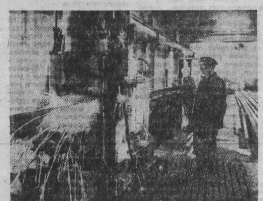
РЕЛСОВСАРОЧНЫЙ поезд № 29 — передовое предприятие Кемеровской железной дороги. Недавно здесь закончилась реконструкция сварочной линии, что дало возможность более полно использовать оборудование, повисылись производительность труда и качество выпускаемой продукции. НА СНИМКЕ: идет автоматическая сварка рельсов.