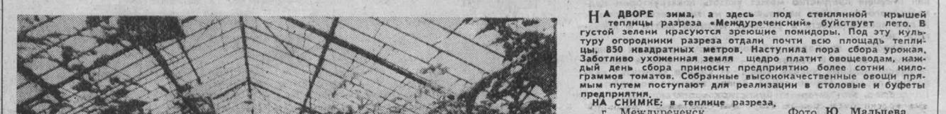
НА ДВОРЕ зима, а здесь под стеклянной крышей теплицы разреза «Мендуреченский» буйствует лето. В густой зелени красуются зрелые помидоры. Под этой культурой огородники разреза стали почти всю площадь теплицы, 850 квадратных метров. Наступила пора сбора урожая. Заботливо ухаживая земля щедро платит советодам, каждый день сбора приносит предпринимателю более сотни килограммов томатов. Собранные высококачественные овощи прямым путем поступают для реализации в столовые и буфеты предприятия.

смете к техническому проекту на расконсервацию завода, углубив охранные сетки шахты имени Вахрушева предусмотреть затраты на долевое участие в строительстве горнозавода. Около миллиона рублей. Правда, эта сумма почти в треть меньше запрошенного областным производственным объединением молочной промышленности. Но все же лучше, чем ничего. Каждому бы, все знают о бедах завода, у всех он стоит в планах, начиная с 1971 года ведутся разговоры о его строительстве, и сроки конкретные назначались не раз. Самый последний срок, который установил в виде бы всех... — 1986 год. Был, пока не пришел на очередной запрос очередной ответ от 10 августа 1984 года. Минмисомолпрома СССР: «Проект основных направлений развития отрасли на период до 2000 года строительство этого предприятия планируется осуществить в 1988—1990 годах. Окончательные сроки возведения указанного объекта... будут определены после согласования... в Госплане СССР». Остается отпаривать еще один вопрос: «Так будут ли шахтеры обеспечены молоком?». Е. ПАВЛОВИЧ, г. Киселевск.