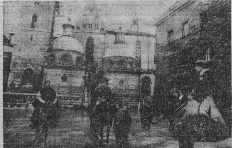
В польской народной республике группа советских кинематографистов во главе с известным автором и режиссером Сергеем Бондарчуком ведет съемки фильма «Борис Годунов»...