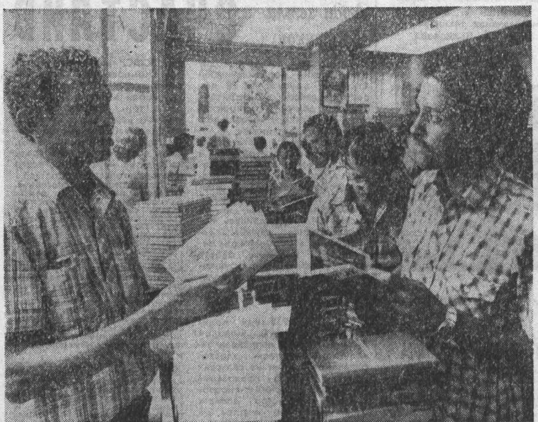
Для кубинских друзей

зненной альтернативы курсу республиканской администрации. Они не проявили ни желания, ни способности бросить вызов Рейгану по жизненно важным для народа проблемам, особенно по вопросам ядерного разоружения и переговоров об ограничении вооружений. Выборы прошли, но серьезные проблемы остаются, продолжает Г. Холл. Экономика США начинает сползать к новому кризису. Экономическое оживление оказалось недостаточным, неблагоприятные тенденции начали проявляться еще до дня выборов, но не столь явно, чтобы избиратели осознали это. Иллюзии, подчеркивает Г. Холл, развеются очень скоро. Созданный телерекламой образ президента будет блекнуть по мере того, как антирабочая, милитаристская, расистская политика Рейгана будет проводиться в жизнь. В статье отмечается, что в ходе избирательной кампании и выборов кандидаты компартии в публичных выступлениях и в печати вели разгромную политику агрессии и войны, политику расизма. Руководитель американских коммунистов подчеркивает, что все элементы антиреяганского фронта — профсоюзное, антивоенное, женское, молодежное движение — должны изыскать пути к тому, чтобы стать единой силой, которая могла бы определять ход политических событий.