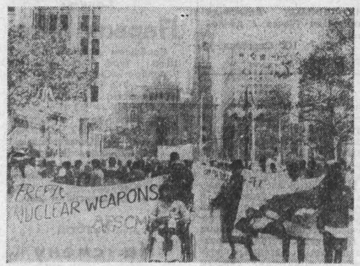
Филаделфия. «Заморозить ядерные арсеналы». «От ядерной войны нет убежища» — с такими транспарантами сотни американцев прошли по улицам этого города (на снимке).

различным отраслям науки и техники. Есть в магазине и специальные секции, где продаются книги для самых юных читателей, альбомы репродукций для любительской живописи. НА СНИМКЕ: у книжного прилавка.