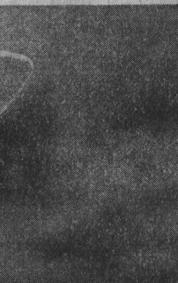
А. Цырякин, корр. «Кузбасса».

ше 3,4 тысячи тонн угля и довели сверхплановый счет с начала года почти до 143 тысяч тонн. Особенно хорошо обстоят дела у горняков шахт «Байдаевская», «Зырянская», имени Ленина. Минувший месяц для шахтеров объединения «Южклуббассуголь». Так, в сентябре они выдали на-гора дополнительно к заданию свыше