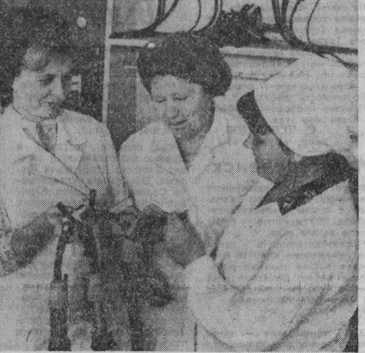
ПРИЯТНОГО АППЕТИТА! В Сибиргинской автобазе появился необычный автомобиль с яркой надписью на борту: «Тайга». Это передвижная столовая. Она обслуживает водителей непосредственно на линии. Сибиргинцы вывозят уголь и вскрышные породы разреза «Междуреченский». Заведет здесь в уловленный час «Тайгу», к ней устремятся все машины автобазы. В уютном, теплом салоне распложены столики, здесь можно попить руки, шоферы получают термосы с горячим питьем. Т. БУЛДАКОВА, г. Междуреченск.