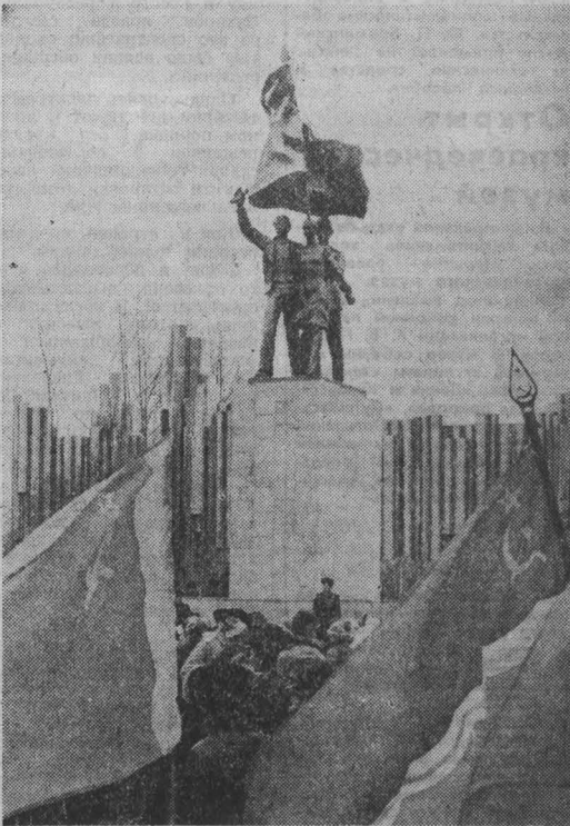
стному содружеству московского скульптора А. Волкова и кузбасского архитектора В. Полтавцева, благодаря усилиям, энтузиазму строителей СВ-4 треста «Кемеровогражданстрой» появился здесь памятник Комсомольской славы: под разветвленными знаменем на высоком пьедестале — три юных представителя неумного комсомольского племени.

Звучат над парком песни комсомольской юности. Усиливаются порывы осеннего ветра, развевшего алые полотно флагов. И кажется, что это из песни шагну-