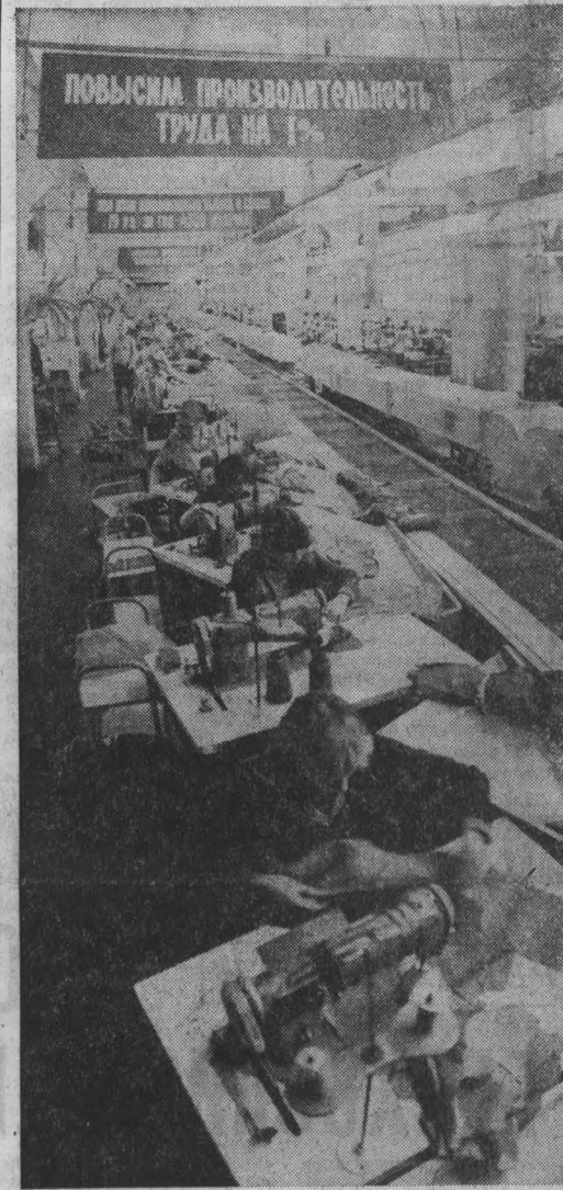
ВСЕ ярче разгорается социалистическое соревнование, посвященное 40-летию Победы, среди швейных потоков осининовской швейной фабрики «Кузбасс». Предприятие работает, постоянно перевыполняя план реализации продукции. НА СНИМКЕ: в первом пошивочном цехе.