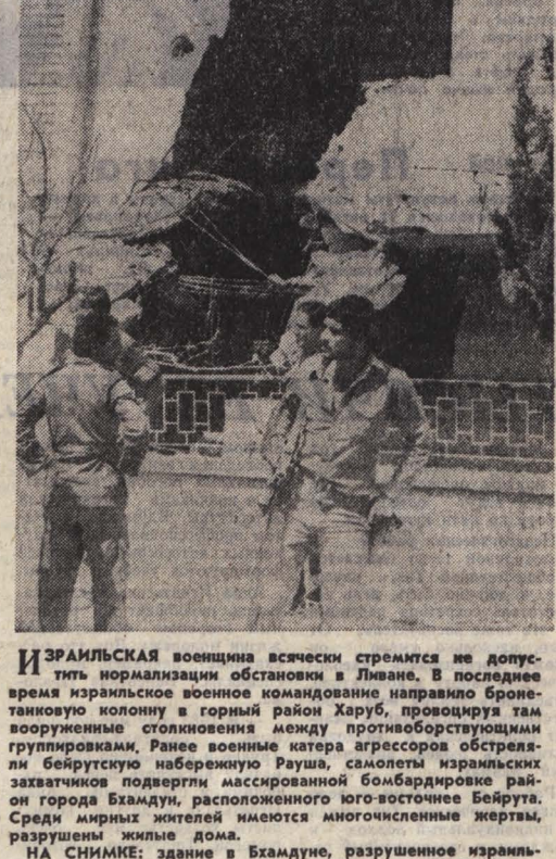
ИЗРАИЛЬСКИЕ ВОЕННЫЕ ВСЕЩЕГО СТРЕМИТСЯ НОРМАЛИЗИРОВАТЬ ОБСТАНОВКУ В ЛИБАНОС. В ПОСЛЕДНЕЕ ВРЕМЯ ИЗРАИЛЬСКОЕ ВОЕННОЕ КОМАНДОВАНИЕ НАПРАВЛЯЕТ БРОНЕТАНКОМУ КОЛОНУ В ГОРНЫЙ РАЙОН ХАРУБ, ПРОЦУРИРУЮ ТАМ ВООРУЖЕННЫЕ СТОЛКНОВЕНИЯ МЕЖДУ ПРОТИВООБЩЕСТВЕННЫМИ ГРУППИРОВКАМИ. РАНЕЕ ВОЕННЫЕ КАТЕРА АГРЕССОРА ОБСТРЕЛЯЛИ БЕЙРУТСКУЮ НАБЕРЕЖНУЮ РАУША, САМОЛЕТЫ ИЗРАИЛЬСКИХ ЗАХВАТЧИКОВ ПОДВЕРЖЛИ МАССОВОЙ БOMBАРДИРОВКЕ РАЙОН ГОРОДА БХАМДУН, РАСПОЛОЖЕННОГО ЮГО-ВОСТОЧНО БЕЙРУТУ. СРЕДИ МИРНЫХ ЖИТЕЛЕЙ ИМЕЮТСЯ МНОГОЧИСЛЕННЫЕ ЖЕРТЫ, РАЗРУШЕНЫ ЖИЛЫЕ ДОМА.

НА СНИМКЕ: здание в Бхамдуно, разрушенное израильской ракетой.