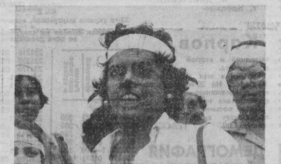
НАРОД Никарагуа хочет мира, но перед лицом непрекращающейся империалистической агрессии никарагуанцы не выпускают из рук оружие, готовы бороться за независимость своей родины. По всей республике проходят массовые митинги, участники которых заявляют о своей решимости отстоять революционные завоевания.

Местные наблюдатели отмечают, что планы освоения территории США представляют собой явную попытку создать неуязвимую ракетно-ядерные силы в целях достижения глобального стратегического превосходства.