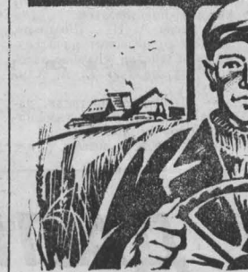
Для успешного выполнения перевозки нового урожая и обеспечения безаварийной работы транспорта