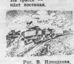
Рис. В. Илландева.

Несколько слов о заготовке семян — основе урожая последнего года пшенички. Засыпка их идет в общем неплохо, с опережением прошлогодних показателей. Просчет агрономы допускают в другом — медлит с проверкой качества семян. К началу третьей декады сентября лишь 56 процентов их прошло соответствующий анализ. А ведь без этой карточки качества семян никак не обойтись: надо уже сегодня знать, с какими семенами придется работать завтра, чтобы заменить непригодные партии в ходе уборки. Это особенно касается агрономов Чебулинского, Марининского, Ленинск-Кузнецкого районов.