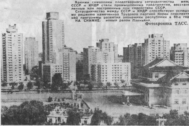
Яркими символами плодотворного сотрудничества между СССР и КНДР стали промышленные предприятия, восстановленные или построенные при содействии СССР...