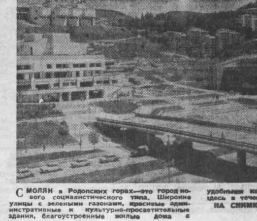
СМОЛЕНСКИЙ ГОРОД — это гордость смолян. Широкие улицы с зелеными газонами, красивые административные и культурно-просветительные здания, благоустроенные жилые дома и