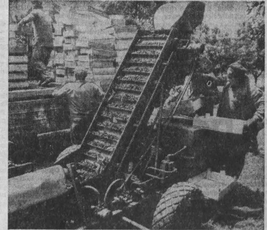
ВЕНГРИЯ. Механизированный способ уборки урожая винограда на ферме «Арамалас» в Рацее.