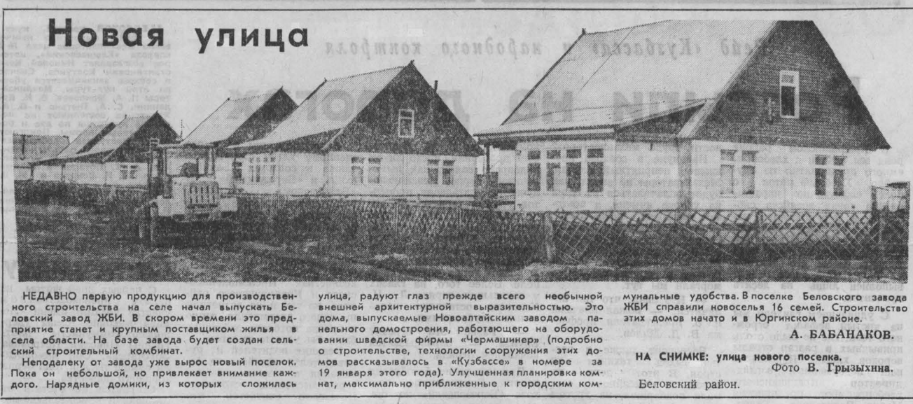
НЕДАВНО первую продукцию для производственного строительства в селе начал выпускать Беловский завод ЖБИ. В скором времени эти предприятия станут и крупным поставщиком жилья в села области.

Вот так и идет наша беседа. В его рабочем столе уже скопилось изрядная папка писем — жалоб. Каждое такое письмо — словно заноза в сердце.