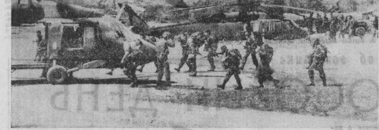
Вашингтон превратил Гондурас в плацдарм для провокационных вылазок против Никарагуа, подавления освободительной борьбы в других странах Центральной Америки. На СНИМКЕ: назарные вертолеты США на аэродроме в районе города Агуанате, расположенного всего в ста километрах от границы революционной Никарагуа.