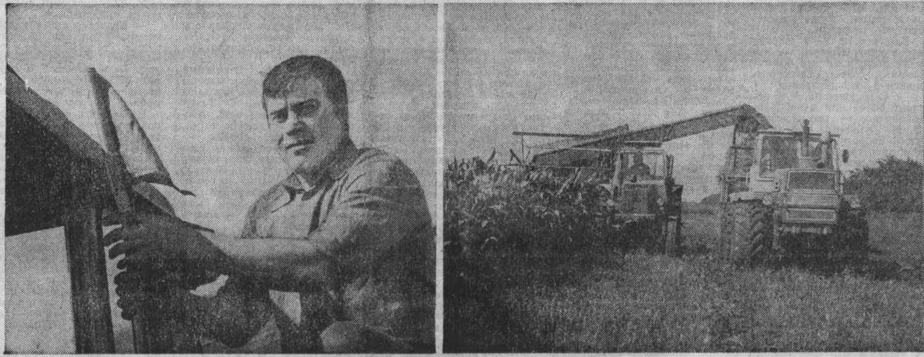
Рейд «Кузбасса» и народного контроля