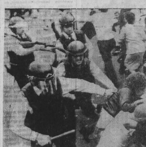
С ГНЕВОМ и возмущением восприняты в Великобритании кровавые события, разыгравшиеся на многострадальной ольстерской земле. Беспорядочный обстрел мирных демонстрантов пластиковыми пулями, умышленный полицией, был совершенно несправедлив, отмечает газета «Гардиан». «Когда полицейские устремились на разгон манифестации, они действовали с беспрецедентной жестокостью. Тех, кто попытался спастись бегством или, споткнувшись, упал на тротуар, доставала полицейская дубинка, — продолжает газета. — Во

с членом Политбюро ЦК КПСС, секретарем ЦК КПСС Г. В. Романовым. Съезд открыл председатель Временного военного административного совета и Комиссии по организации партии трудящихся Менгисту Хайле Мариам.