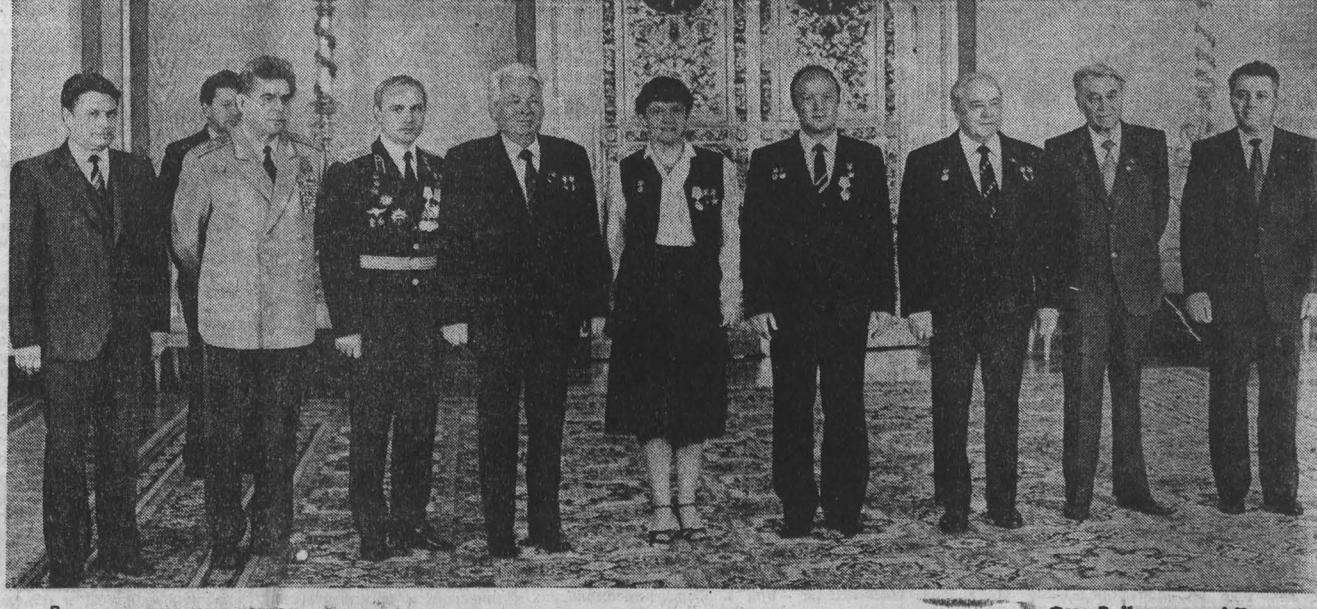
Во время вручения наград.