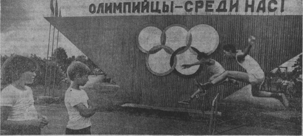
СПОРТИВНО-оздоровительный лагерь «Олимп» Западно-Сибирского металлургического комбината расположен в живописной зоне отдыха на левобережье реки Кондома. В лагере есть различные спортивные площадки, плавательный бассейн, новые жилые корпуса. Все это позволило ребятам развить свои физические навыки, повысить спортивное мастерство.