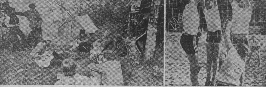
НА СНИМКАХ: тренировка легкоатлетов; острый момент на волейбольной площадке; любимые песни у костра.