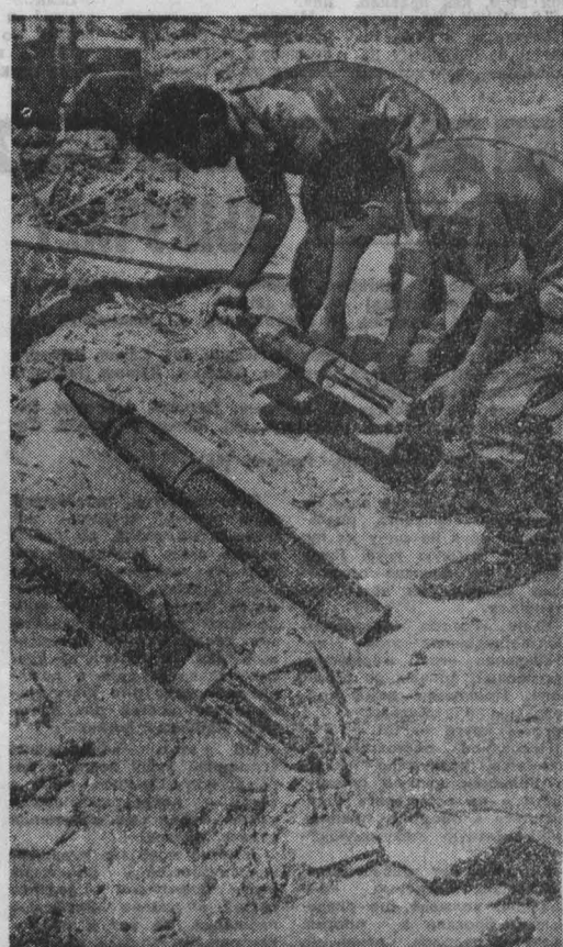
ПРАВИТЕЛЬСТВО Ливана принимает дальнейшие меры по ликвидации последствий ливанской трагедии, виновниками которой являются израильские агрессоры...