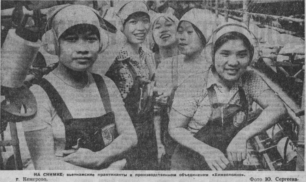
НА СНИМКЕ: вьетнамские практиканты в производственном объединении «Химволокно».