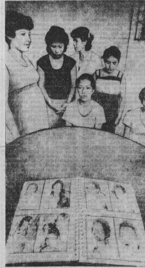
РЕАКЦИОННЫЙ режим Сальвадора, возглавляемый ставленником Вашингтона администратором Дуарте, продолжает политику геноцида на территории своей страны...