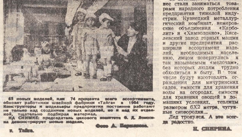
63 новых моделей, или 74 процента всего ассортимента, обновят работники швейной фабрики «Тайга» в 1984 году.

Это говорит о том, что многие предметы быта, находившиеся ранее в разряде дефицита, настолько заполнили рынок, что теперь торговля предъявляет к ним жесткие условия. И справедливо! Высокое качество и разнообразный ассортимент — таковы ныне требования покупателя. И промышленники, как раньше, не отмахиваются от этих претензий. Они перестраиваются, ищут, торгуются, изготавливают такую продукцию, которая пользовалась бы спросом.