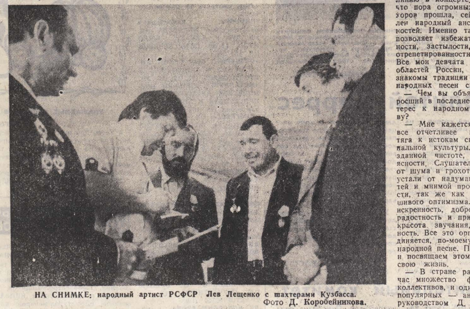
НА СНИМКЕ: народный артист РСФСР Лев Лещенко с шахтерами Кузбасса.