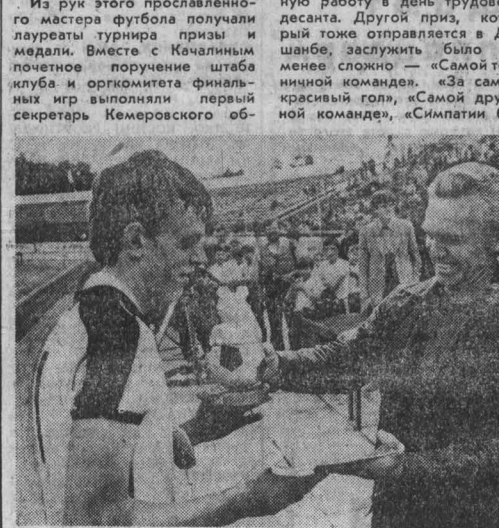
Продолжаются игры второго круга чемпионата СССР по футболу среди команд четвертой зоны второй лиги класса «А».

Качалин. — Я не преувеличиваю: ведь среди участников только победители республиканских и зональных соревнований — значит чемпионы. Одни команды завоевали медали, другим на этот раз не повезло, но не это главное. Важно, что проигравших на нашем турнире нет. Выиграли участники и болельщики, выиграли сотни тысяч мальчишек — члены клуба «Кожаный мяч», выиграли футбол, которому все мы преданы. Значит, до свидания, «КМ-84!» Здравствуйтесь, новые турниры «Кожаного мяча», вступающего в свое третье десятилетие! И. ЛЯХОВ.