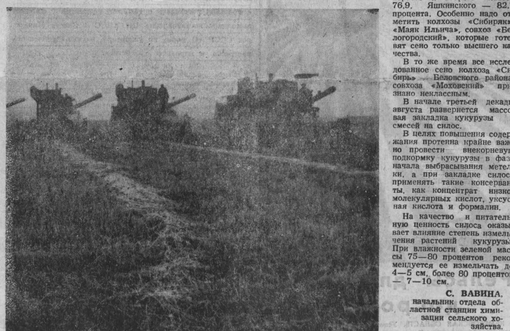
Уборку нового урожая ведут хозяйства Юргинского района.

На 12 августа горожане заготовили 53 тысячи 141 тонну сена, выполнив задание на 75,9 процента. По городам выполнение задания характеризуется следующими показателями (в первой колонке — задание, во второй — фактическое выполнение — оба показателя в тысячах тонн, в третьей колонке — процент выполнения задания): Маринск 1,1 1,383 125,7 Березовский 1,4 1,407 100,5 Междуреченск 2,7 2,700 100 Тайга 0,7 0,700 100 Топки 1,1 1,100 100 Кемерово 14,0 13,092 93,5 Мыски 1,4 1,275 91,0 Юрга 2,2 1,850 83,6 Гурьевск 1,3 1,030 79,2 Ленинск-Кузнецкий 4,8 3,785 78,9 Анжеро-Судженск 3,2 2,450 76,6 Новокузнецк 15,4 11,334 73,6 Осинники 2,9 2,060 71,0 Киселевск 3,6 2,153 59,8 Белово 4,6 2,745 59,6 Проктоловск 7,6 3,768 49,6 Таштагол 2,0 2,009 100,5 Как видно из анализа, положение дел по городам далеко не равномерное. Наряду с хорошей организацией труда в таких городах, как Маринск, Березовский, Междуреченск, Тайга, Топки, наблюдается и непонятная безответственность. Когда, например, собираются выполнить свое задание в Таштагоде? Там, видимо, забыли, что на календаре не начало июля, а середина августа. Промедление с разрыванием важной кампании повлияло и проколчало. Для того, чтобы наверстать упущенное, необходимо мобилизовать все силы.