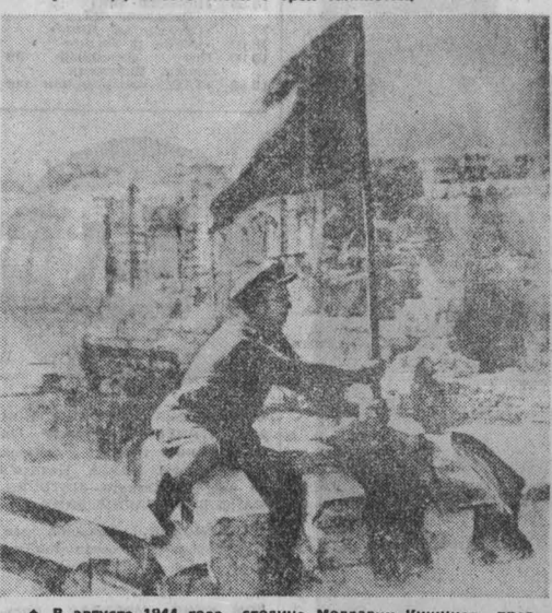
В августе 1944 года столица Молдавии Кишинев пред- стала перед советскими воинами-освободителями грудями руи. За советские послуженные лет Кишинев превратился в круп- ный центр промышленности, науки и культуры.