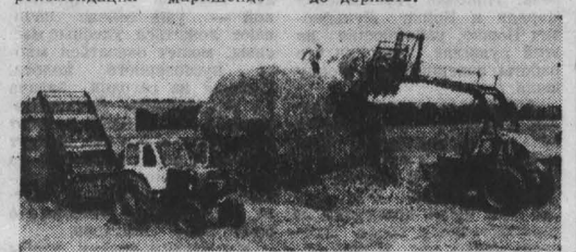
Адрес: Чебулинское РАПО, совхоз «Чебулинский»

В итоге шахта отстала от плана в прошлом году на 200 тысяч тонн. За это тысячу тонн перевалили сверхнормативные потери угля в недрах. Тогда материально наказали и некоторых начальников участков. На участках № 4, 7 и 11, например, вместо шестой системы отработки применили другую, из-за технологических просчетов увеличили зольность угля. Но и сегодня остаются без внимания рекомендации маркшейде-