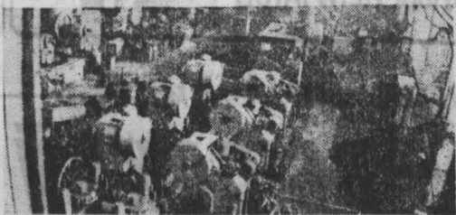
Адрес: объединение «Кемеровоуголь», Беловский энергостроительный завод