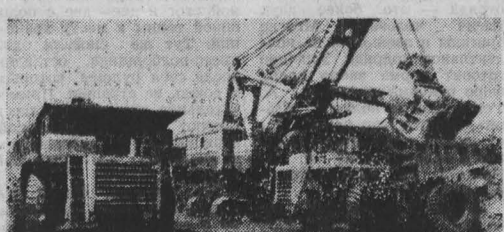
Адрес: объединение «Проктопескуголь», шахтоуправление им. Калинина

— Вопросы, связанные со снижением себестоимости и повышением производительности труда, — рассказывает секретарь партбюро, — мы поднимаем едва ли не на всех открытых партийных собраниях. На них приглашаем работников планового отдела, производственную службу снабженцев. Особое внимание уделяем расстановке кадров на ответственных постах у нас поставлены коммунисты, и