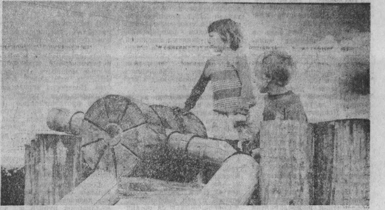
Недавно самые маленькие жители села Дарено получили замечательный подарок — детскую площадку. Этот сказочный деревянный городок восхищает не только детей, но и взрослых. НА СНИМКАХ: фрагменты оформления детской площадки.