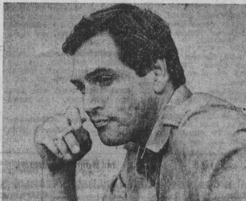
У НАС НА ГАСТРОЛЯХ