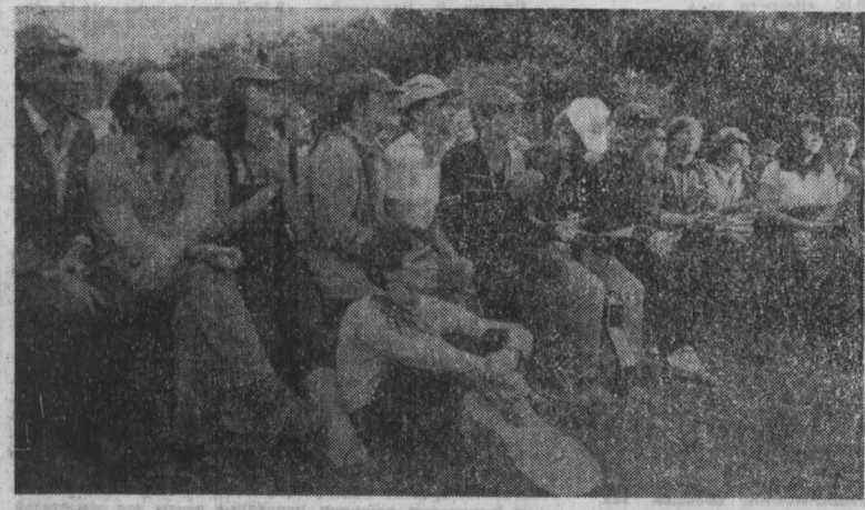
В коллективах художественной самодеятельности