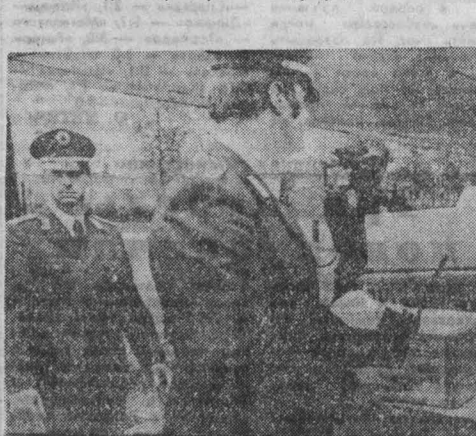
П подсчет результатов проведенного в ФРГ всенародного опроса относительно размещения в стране новых ядерных ракет...