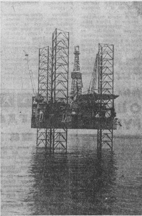
НА КОНТИНЕНТАЛЬНОМ шельфе близ приморского города Вунгтау на юге Вьетнама получена первая нефть...

НА СНИМКЕ: морская буровая платформа начинает бурение второй скважины на шельфе.