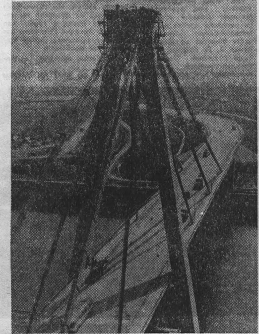
РУМЫНИЯ. Завершено строительство судоходного канала Дунай—Черное море. Новая транспортная магистраль длиной 64,2 километра и шириной 70—90 метров проложена по трассе Чернавода—Аджида. НА СНИМКЕ: мост через канал в районе Аджиды.

ПНОМПЕНЬ, 28. (ТАСС). Центральный Комитет Народной революционной партии Кампучии принял постановление о праздновании 33-й годовщины образования партии. Мынешнюю годовщину, говорится в документе, кампучийский народ отмечает в обстановке высокого политического и трудового подъема. Поминки вменяются успехами, достигнутыми Народной Революционной партией Кампучии. Уверены, преодолеваются последние этапы правления полуголодного режима геноцида, быстрыми темпами развивается сельское хозяйство, стабилизируется промышленное производство. Значительные достижения в жилищном строительстве, становлении всесторонней системы здравоохранения. Гордостью народной власти являются успехи в расширении народного просвещения.