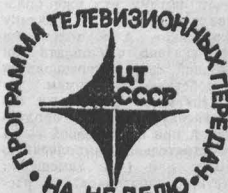
ТАСС, 28 июня.