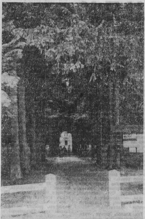
ФРАНЦИЯ. НА СНИМКЕ: на этом месте была деревня Флери. В первую мировую войну от нее не осталось ничего. Все жители погибли. На месте Флери вырос лес. В нем сохраняются дорожки, проходившие по тем местам, где когда-то были улицы, стоят таблички с их названиями. Лишь в центре селения построена часовня в память о погибших интеллигах.

БОНИ. На огромную опасность, нависшую над планетой в результате стремления нынешней администрации США вернуть гонимости в космическое пространство, указали участники состоявшейся в Ганновере пресс-конференции. Она была организована инициаторами проведения откровенного обсуждения в этом городе междунационального конгресса ученых, выступающих против милитаризации космоса. До настоящего времени, указывалось на пресс-конференции, только Советский Союз выступил со всеобъемлющими предложениями по предотвращению милитаризации космического пространства. В то же время здесь подчеркивалось, что подлинными виновниками резкого ухудшения международной обстановки являются Соединенные Штаты и прежде всего президент Рейган, публично выступивший с форсированной разработкой систем противоспутникового оружия, размещенные в космосе противоракетные системы.