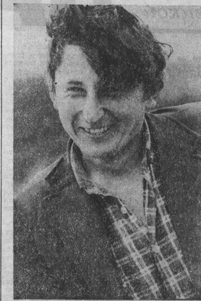
На темы дня

ЗАДАЧА СОВХОЗОВ И КОЛХОЗОВ — ВЫРАСТИТЬ ХОРОШИЙ УРОЖАЙ