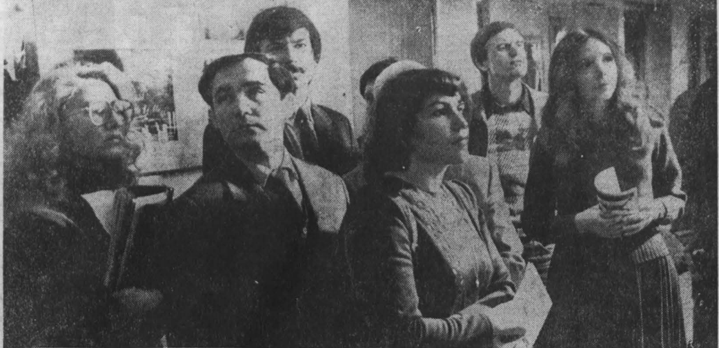
Фото Ю. Сергеева, г. Кемерово.