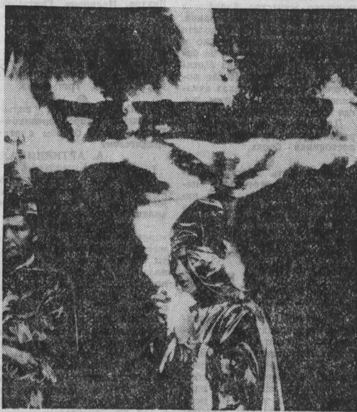
США. Пользуясь откровенным попустительством, а зачастую и прямым пособничеством властей, члены ультраправой террористической организации «Ку-клукс-клан» действуют все более открыто и нагло.

А ДЕЛИ. Премьер-министр Индия Индира Ганди выступила за принятие немедленных мер для прекращения развязанной реакановской администрацией гоним ядерных вооружений.