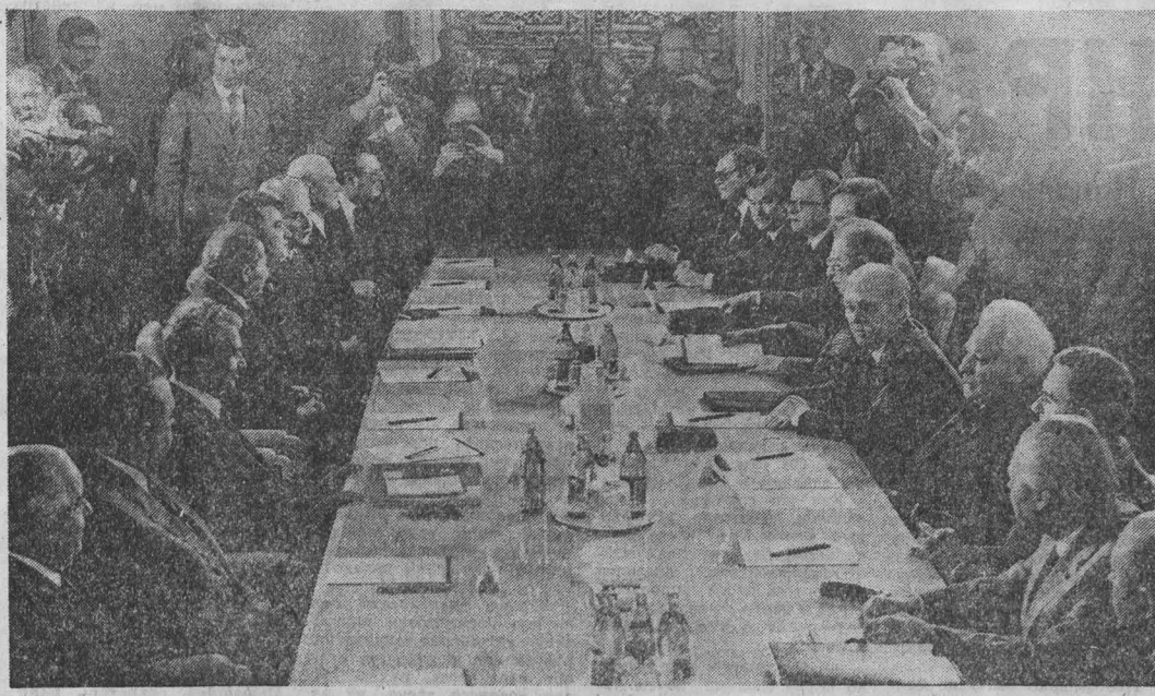
Во время переговоров.

4 июня в Кремле состоялась встреча Генерального секретаря ЦК КПСС, Председателя Президиума Верховного Совета СССР К. У. Черненко и Президента СРР Н. Чаушеску, в которых приняли участие: с советской стороны — член Политбюро ЦК КПСС, Председатель Совета Министров СССР Н. А. Тихонов, член Политбюро ЦК КПСС, первый заместитель Председателя Совета Министров СССР, министр иностранных дел СССР А. А. Громыко, член