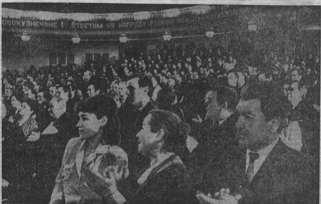
НА СНИМКАХ: вручение ордена Октябрьской Революции городу Новокузнецку.