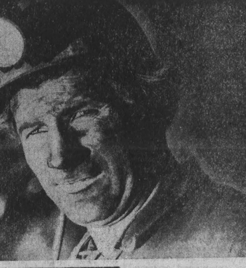
Фотографии с выставкой: В. СОХАРЕВ, Звеновая (Звеновая шахты «Распадская», В. Угале); А. ГОРНОСТАЕВ, В поисках фотографии; А. КАЛИНИН, «Хочу быть!».