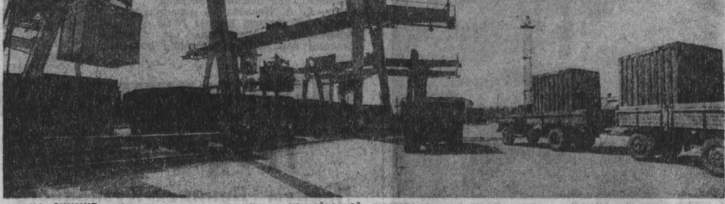
НА СНИМКЕ: механизированная погрузка на контейнерной площадке.

Год и четыре месяца на Кемеровском грузовом дворе идет эксперимент. Каков результат? Ответить на этот вопрос и было целью нашего рейда.