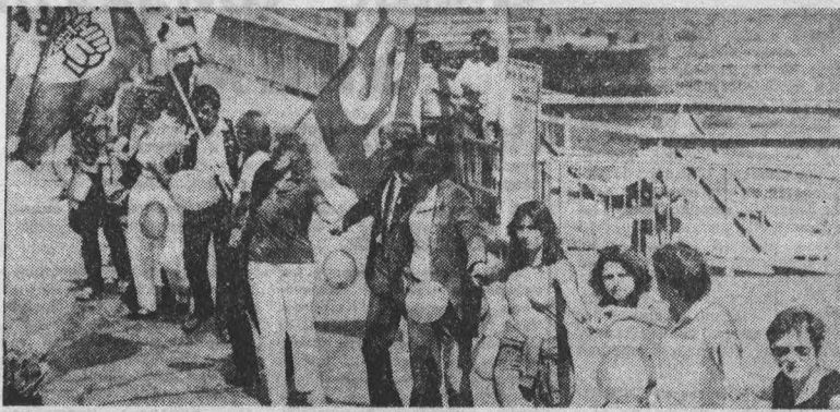
КЕЛЬН. Участники выступлений, взявшись за руки, опоясали центральные районы города, символически обозначив зону, свободную от ядерного оружия.

Долгие годы американские ветераны добивались признания и ответственности правительства США за применение «агентства оранж» в вьетнамской войне. Однако в Вашингтоне серьезно озабочены. Там опасаются, что напоминание о вьетнамской войне вызовет возмущение общественности, затруднит внешнеполитическую, наращивания и без того огромных арсеналов химического оружия. Политический эксперт считает, что Белый дом вновь примет все, чтобы блокировать судебное разбирательство.