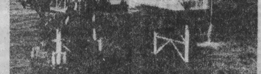
Индия. Нефтедобывающая промышленность — одна из наиболее динамично развивающихся отраслей государственного сектора национальной экономики.