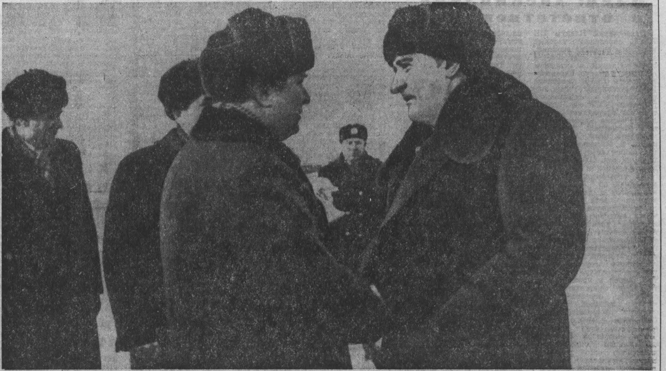
НА СНИМКЕ: встреча в Новокузнецком аэропорту.

В ходе беседы были затронуты вопросы безусловного выполнения планов и обязательств четвертого года пятилетия в свете решений декабрьского (1983 г.) Пленума ЦК КПСС, положений и выводов, содержащихся в выступлении Генерального секретаря ЦК КПСС Ю. В. Андропова. Росте производительности труда и снижения себестоимости продукции, улучшения организации труда, роли трудовых коллективов в укреплении плановой, технологической и трудовой дисциплины. Были обсуждены проблемы разви-