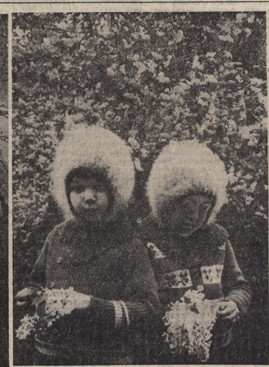
ДВОЕ Я видел дуб в Луизиане... ...Но странно мне было, что он мог в одиночестве, без единого друга, шептаться так весело листвою, ибо я на его месте не мог бы. УЛТ УИТМЕН. Умирают деревья. Человек ли тому причиной, сама ли природа-мать определила им преждевременную гибель! Но вот стоят они, иссохшие стволы, и ждут лишь сильного ветра, чтобы качнуться, застонать в последний раз и рухнуть в траву. Эти выстоят дольше других. Обънявшись кронами, опираясь друг на друга ветвями, они вместе противоборствуют непогодам и в пору юности, и в зрелые годы, и на закате земного бытия. Каждый ураган разбивает об их тесный союз, об их молчаливую дружбу! С первых дней сплелись они корнями, тогда еще тонкими и слабыми. Но мужали, вздымались под муроме небо стволы — и крепла глбкая связь мощных плетей, в монолит превраща- лось хрупкое первоначальное братство... Рядом пойдут по жизни эти два мальчика. Сейчас их родство крепится лишь общими детскими впечатлениями, детскими интересами. Но пройдут годы, сиюды радости и печали выведут их судьбы, и множество неразрывных нитей возникнет между их душами. А. СОРОКИН. «ДЕРЕВЬЯ», «ДУЭТ». (г. Новокузнецк).

МИНСК, 30. (Корр. ТАСС). Молодые поколения должны помнить о пережитом нашим народом в минувшую войну. Помнить и не допустить новой трагедии. Эта мысль главной на митинге — речнике участников и гостей. Всесоюзной вахты памяти: котлом прощанья на мемориальном комплексе «Хатынь». На митинге юноши и девушки пополнили сохранить мир на Земле.