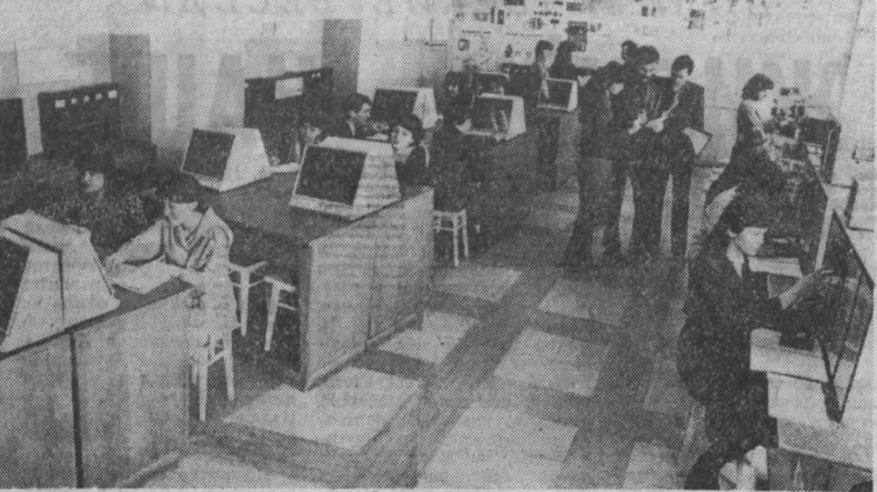
На снимке: студенты КемТИПа в лаборатории автоматизации производственных процессов.

Гидрометбюро сообщает: 27 апреля облачно с прояснениями. Ветер юго-западный 9-14 метров в секунду. Температура 1-6 градусов тепла.