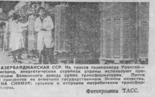
АЗЕРБАЙДЖАНСКАЯ ССР. На трассе газопровода Уренгой—Унгурод, энергетических строителей используют продукцию Банинского завода сухих трансформаторов. Почти 70 процентов ее отмечено государственными Знаком качества. НА СНИМКЕ: готовые и отправные потребители трансформаторы.

КИРОВОНАН (Армянская ССР). Выпуск станков с числовым программным управлением освоил Кировоананский завод прецизионных станков. Они предназначены для изготовления сложных по конфигурации деталей из особо прочных материалов. Первая партия оборудования отправлена приборостроительным и машиностроительным заводам страны.