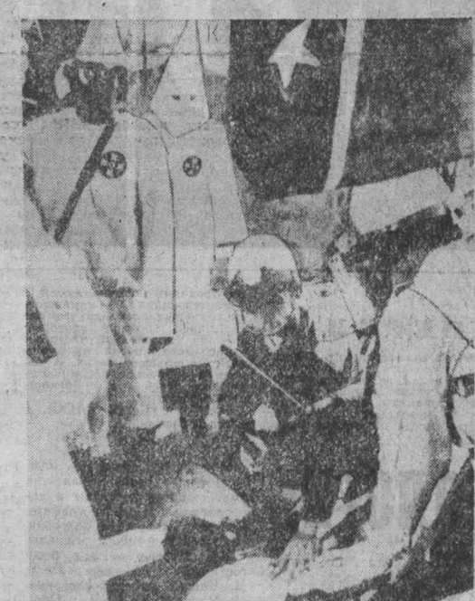
США. Арестами и расправой ответили власти города Остин (штат Техас) на выступление прогрессивной общественности против антиядерной в стране индустриальной и других радиационных и ультрафиолетовых группировок.

Агентство печати Новости предлагает вниманию читателей с некоторыми сокращениями фельетон известного американского публициста А. Бухвальда, опубликованный в газете «Интерстэйт геральд трибюн».