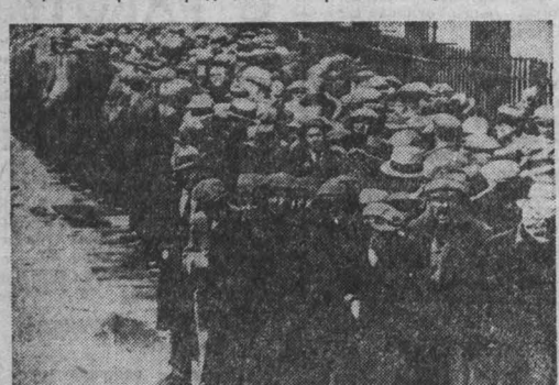
США. Этот снимок сделан более 50 лет назад. Но как и во времена «великой депрессии»...